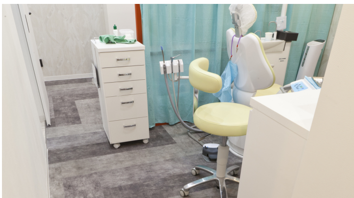
Flotex Concrete planks Concrete smoke